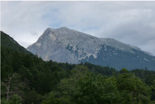
Pleisenspitze (Blick von Scharnitz)