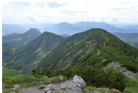
Brünnstein – Steilnerjoch - Unterbergerjoch