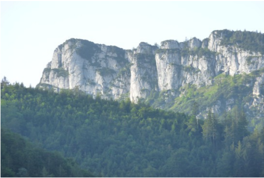
Gedererwand (Gipfel: links)